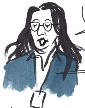
Hymel AYOUBI IDRISSE, Membre du Comité des Droits de l'Enfant - ONU