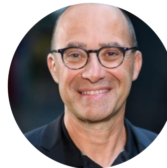
Pierre Salignon Chef du centre des opérations humanitaires et de stabilisation Centre de crise et de soutien, Ministère de l'Europe et des Affaires étrangères