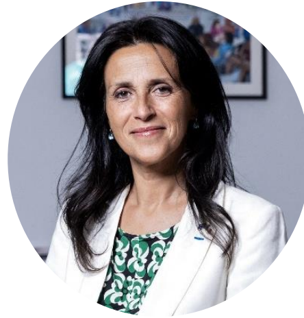
Chrysoula Zacharopoulou Secrétaire d'Etat chargée du Développement, de la Francophonie et des Partenariats internationaux Ministère de l'Europe et des Affaires étrangères