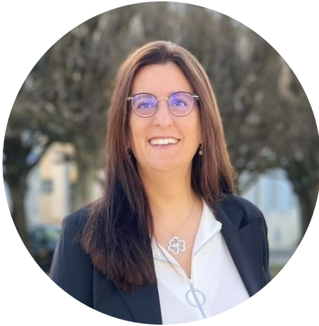
Perrine Goulet Députée de la Nièvre Présidente de la Délégation aux droits des enfants Assemblée Nationale