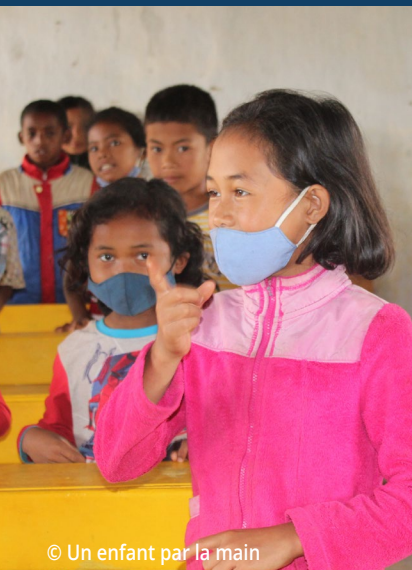
© Un enfant par la main

MADAGASCAR Région Analamanga District d'Ambohidratrimo Commune d'Antanetibe-Mahazaza